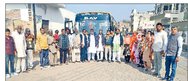
सीवन। सीवन से कुरुक्षेत्र के लिए रवाना होते लोग।

इस योजना के तहत कक्षा दूसरी और तीसरी के शिक्षकों द्वारा प्रतिदिन 35 से 45 मिनट की एक विशेष उपचारात्मक कक्षा आयोजित की जाएगी। इन कक्षाओं में विद्यार्थियों को उनकी दक्षताओं पर अभ्यास करवाया जाएगा, जिनमें वे पिछड़े रहें हैं। इस योजना की अंतिम तिथि 20 दिसंबर निर्धारित की गई है। साप्ताहिक आंकलन और रिपोर्टिंग प्रणाली: योजना के प्रभावी क्रियान्वयन के लिए साप्ताहिक आंकलन और रिपोर्टिंग प्रणाली लागू की गई है। प्रत्येक साप्ताह शिक्षक विद्यार्थियों की प्रगति का मूल्यांकन करेंगे और रिपोर्ट तैयार कर संकुल, खंड और जिला स्तर पर भेजेंगे। इन रिपोर्टों के आधार पर विद्यार्थियों की प्रगति का विश्लेषण किया जाएगा।