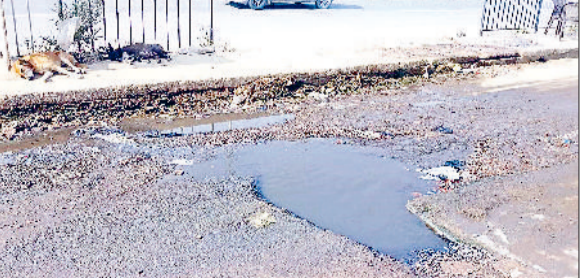
उद्याना। सर्विस रोड पर सीवरेज ओवर फ्लो होने से भर दूषित पानी।