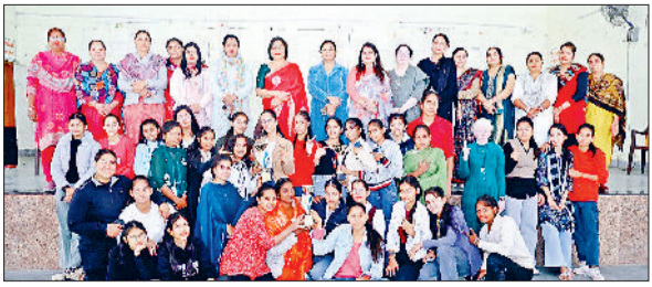
जीद। ट्रॉफी के साथ छात्राएं।

गत 23-24 नवंबर को मैटिस डिग्री कॉलेज अंटा में हुए सप्ताहों जॉन के क्षेत्रीय युवा उत्सव में हिंदू कन्या महाविद्यालय जीद ने ओवरऑल ट्रॉफी हासिल की।