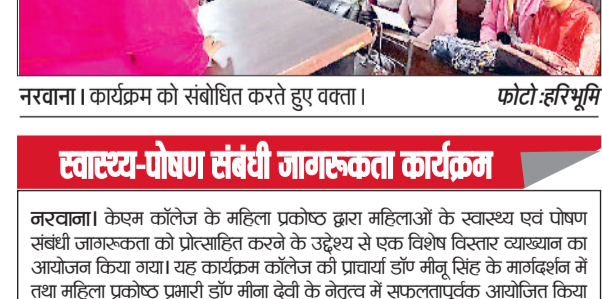
नरवाना। कार्यक्रम को संबोधित करते हुए वक्ता।

उपलब्धि को लेकर काफी उत्साह और विगत वर्षों की भांति इस वर्ष भी 2025-26 के जौनल युवा उत्सव की ऑलओवर ट्रॉफी हासिल कर छात्राओं ने महाविद्यालय की सांस्कृतिक क्षेत्र की उपलब्धियों के इतिहास में एक और अध्याय जोड़ दिया है।