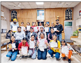
कैथल। आरकेएसडी कॉलेज कैथल के युथ रेड क्रॉस स्वयंसेवकों को सम्मानित करते पदाधिकारी।