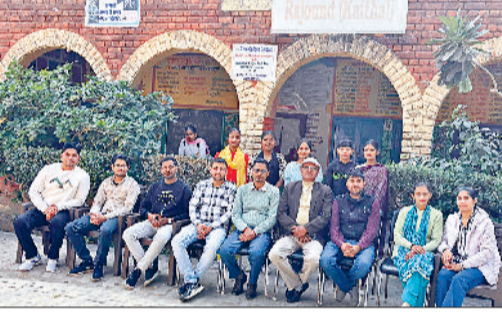
राजौड़। कार्यक्रम में भाग लेते विद्यार्थी व स्कूल स्टाफ सदस्य।