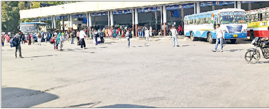
कैथल। बस न होने के कारण खाली पड़ा बस स्टैंड।