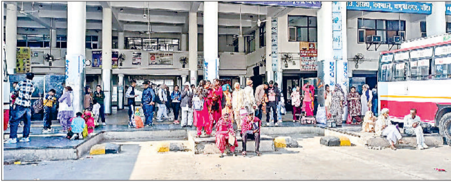
जींद। बस अड्डा पर परेशान यात्री।

कुरुक्षेत्र में मंगलवार को प्रधानमंत्री नरेन्द्र मोदी के आगमन पर जींद से लोगों को ले जाने के लिए कुल 180 बस रवाना हुईं। इसमें रोडवेज बसों की संख्या 118 रही, जबकि सोमवार को 113 रोडवेज बस कुरुक्षेत्र भेजे जाने की योजना थी। मंगलवार को कुरुक्षेत्र जाने वाले लोगों की संख्या को देखते हुए पांच और अतिरिक्त रोडवेज बस लगाई गईं। जबकि परिवहन समिति की 60 से ज्यादा बस कुरुक्षेत्र गईं। ऐसे में यात्रियों को परेशानी का सामना करना पड़ा। जींद से अलसुबह चलने वाली लंबे रूट की बसों के साथसाथ लोकल रूट पर यात्रियों को परेशानी का सामना करना पड़ा। जींद से अल सुबह चार बजकर 20 मिनट पर चंडीगढ़, सुबह साढ़े पांच बजे गुरुग्राम व पटियाला, पांच बजकर 40 मिनट पर पौडासाहिब, पांच बजकर 50 मिनट पर हरिद्वार, छह बजकर 20 मिनट हरिद्वार, सात बजकर 50 मिनट पर हरिद्वार, नौ बजकर 25