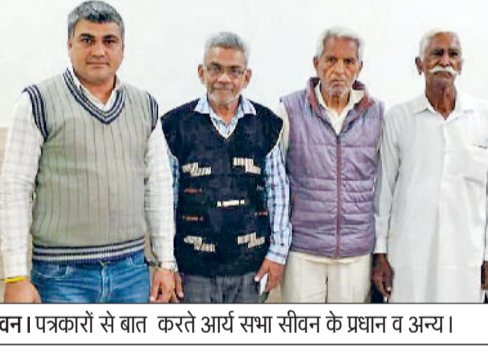
सौवन। पत्रकारों से बात करते आय सभा सौवन के प्रधान व अन्य।